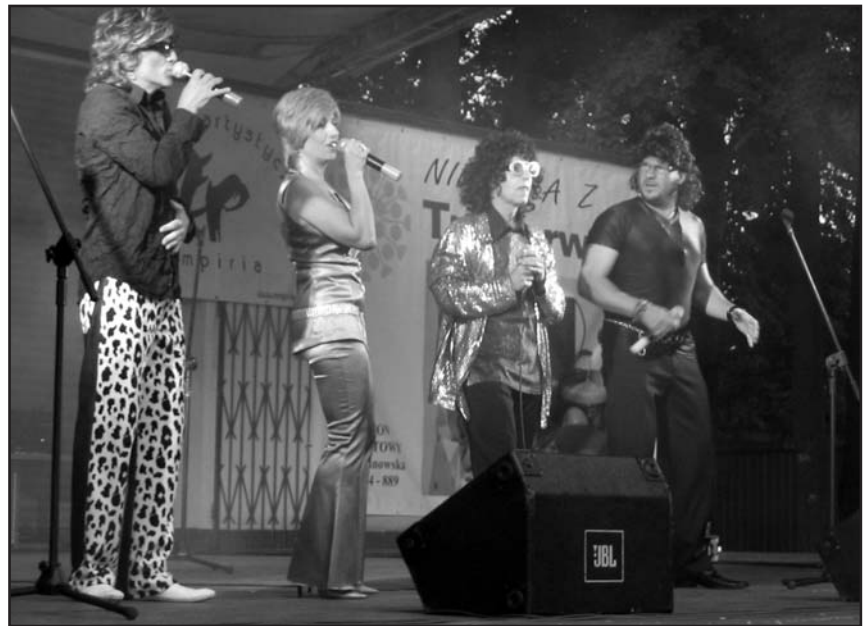
Ich parodie Abby są często lepsze od oryginału