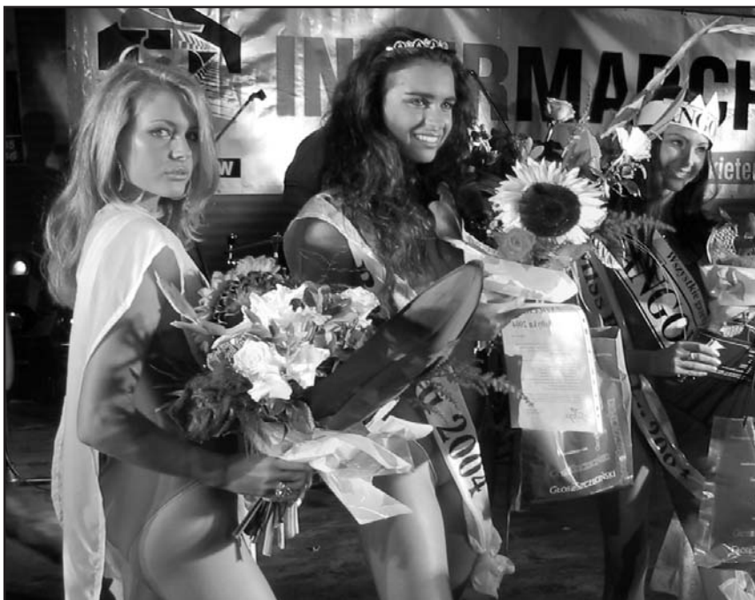
Trzy najpiękniejsze dziewczyny tego wieczoru

wpadka prowadzącego, Oliviera Janiaka – pomylił on Czesława Niemena z Czesławem Miłoszem!