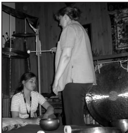
Masaż dźwiękiem trwa najczęściej godzinę

Żeby oderwać się od tych pesymistycznych myśli zaczyna seans.